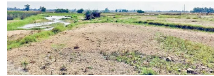
పనుల్లో ముందడుగు పడకుండా చేస్తున్నాయి.

మరిపెడ మండలం ధర్మారం గ్రామంలోని వంతెన వరదకు కొట్టుకుపోయింది.. పునర్నిర్మాణ పనులపై పురోగతి లేదు. ధర్మారం వాసులు ఖమ్మం వైపు వెళ్లటానికి.. అటువైపు వారు మహబూబాబాద్ వైపు రావటానికి దూర ప్రాంతం నుంచి తిరిగి రాకపోకలు సాగించాల్సి వస్తోంది.